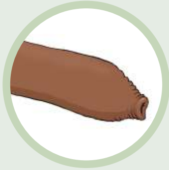
Pénis não circuncidado

A circuncisão é a retirada da pele que cobre a cabeça do pénis. Esta pele é chamada de prepúcio.